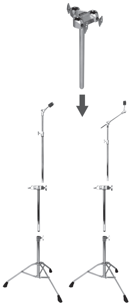
Стойка для тарелок